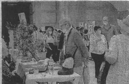
Les visiteurs découvrent le salon dans la belle salle du Cube.