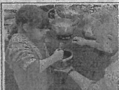
Les enfants ont apprécié de faire chanter les bols.

ces points qui le prendront en charge et créeront une harmonie positive. Il s'intéresse aussi beaucoup aux archives akashiques. « Notre âme vit depuis très longtemps dans X vies. L'akasha (mot sanscrit qui veut dire la substance énergétique dont toute vie est issue) est l'enregistrement de nos vies gardé dans l'Akashique, espace énergétique protégé par les gardiens de l'Akasha, des êtres de lumière qui sont là pour garder les mémoires et les protéger. Il y a des règles pour aller chercher dans les souvenirs de l'âme et prendre conscience des blocages du passé. Il faut être autorisé par le patient à ouvrir les portes des archives, comprendre le schéma récurrent pour pouvoir entreprendre des soins, atteindre notre plein potentiel. JV